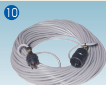
リモコン中継コード