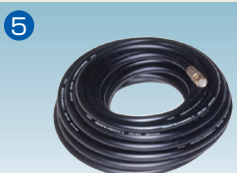
12φ高圧用スラリーホース