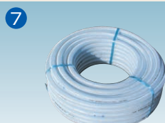
12φオーバー(高圧)ホース