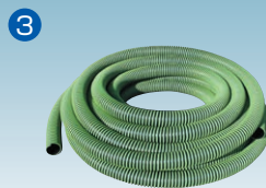
50φ・65φバンナーTMホース